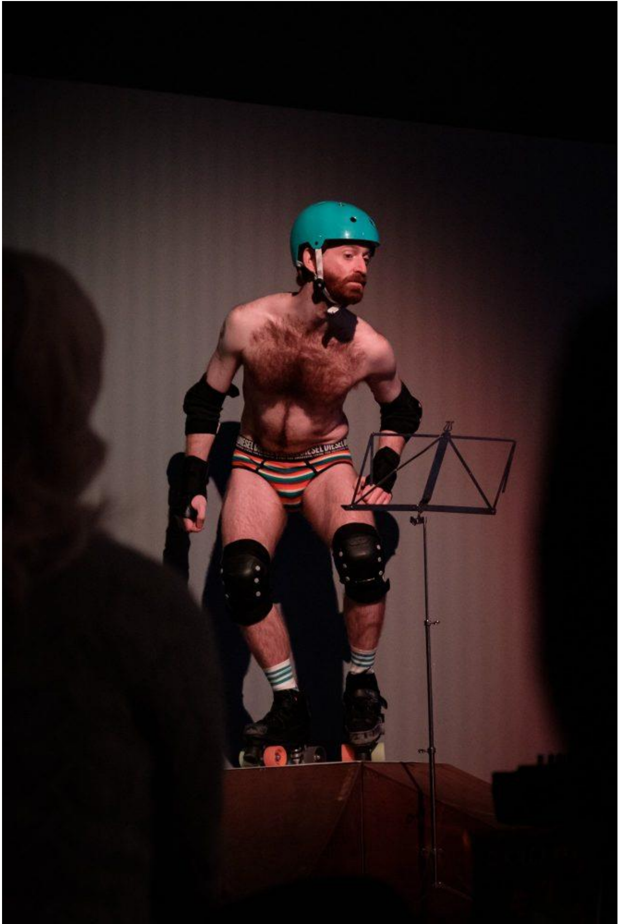
the Amygdala Sonatas at PERIFEST 2022