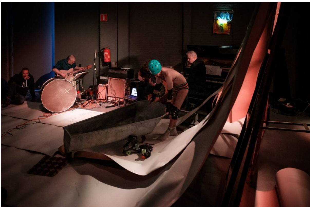
the Amygdala Sonatas at PERIFEST 2022

19 March 2022 | Amygdala Sonatas try-out. The Amygdala Sonatas have their try-out performance at PERIFEST 2022 in Deventer. We support the try-out that was conceived at one of our Residency in Spielberg the year before. The try-out is meant to generate material to further develop the performance. We aim to apply for funding together with the artistic team for further development and production of the performance in 2023.